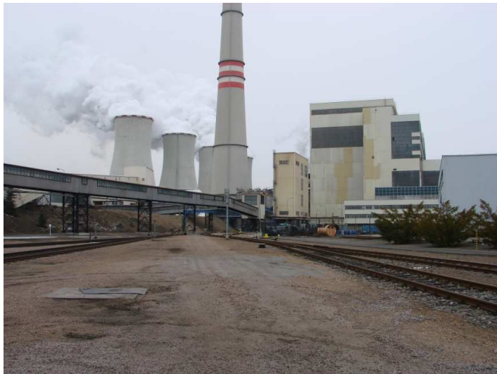
Pohled na elektrárnu