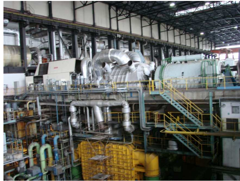
Turbína a generátor