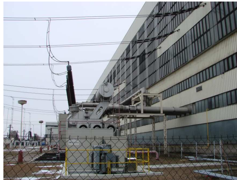
Rozvodna – transformátor 400 kV